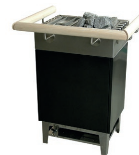
VG 503 с поручнями

Мощность печи: 4,5-9 кВт Парогенератор 3 кВт Объем парилки: 4-12 м 3